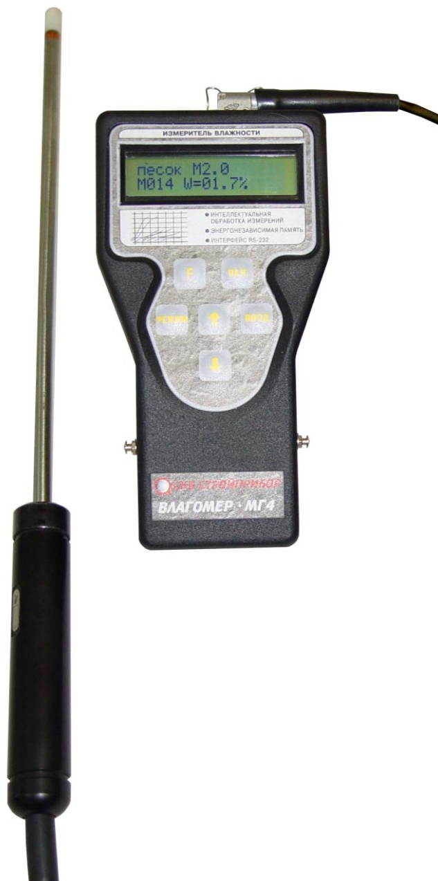
Рисунок 1 – Общий вид измерителя влажности электронного Влагомер-МГ4-3

На торцевой поверхности электронного блока размещено гнездо соединительного разъема для подключения зондового преобразователя.